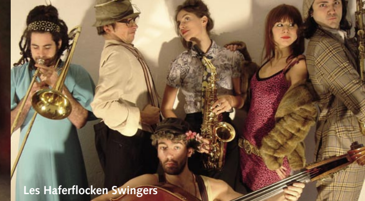
Les Haferflocken Swingers