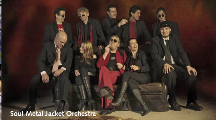
Soul Metal Jacket Orchestra